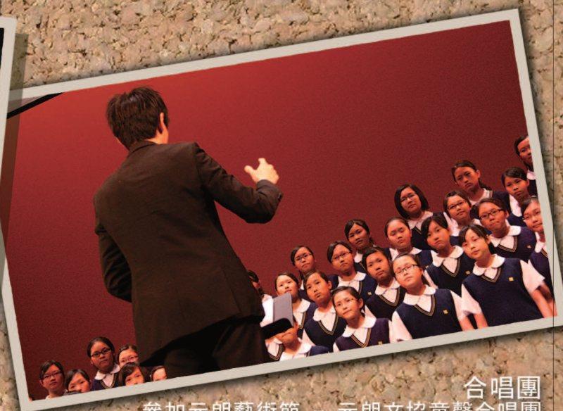
合唱團 參加元朗藝術節 - 元朗文協童聲合唱團 「合唱精英音樂會」