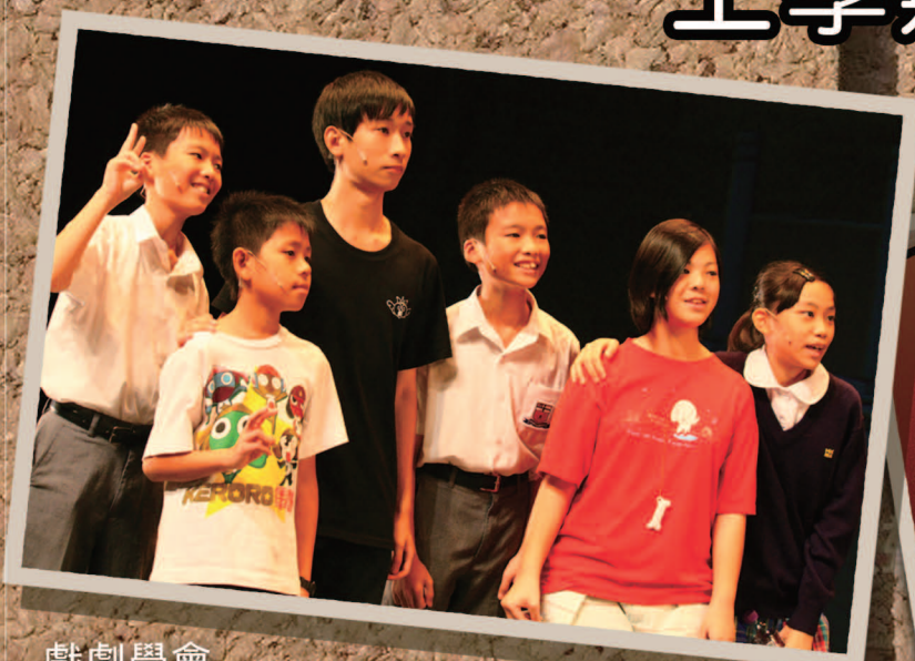
戲劇學會 參加元朗藝術節〈我是元朗人@羅桂祥〉戲劇演出