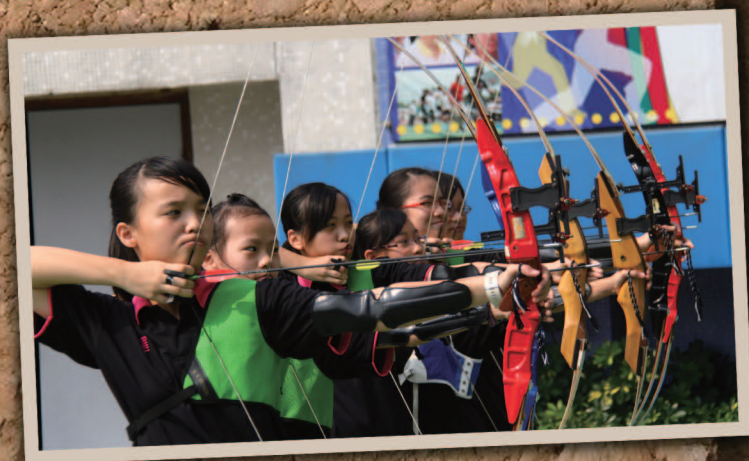
箭藝組 香港盾射箭比賽 兩冠一亞一季 東區射箭比賽 亞軍 羅桂祥盃 四冠四亞四季