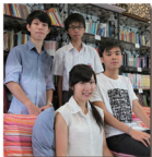
高者成績優異同學

科學科教師利用共同備課節，討論教學內容及教學法，調適課程，並共同設計及完善促進學習的課業。惟數學科則因新高中課程安排緊迫和初中改用英語授課的關係，故科本教師發展計劃將順延至 2011 - 2012 學年進行。