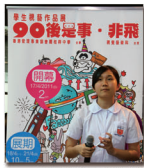
社區藝術展：90後是事·非飛