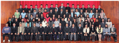
2010 - 2011 教職員合照