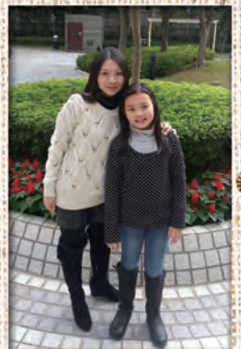
記者：4A 吳咏琪、 4A 李淑筠