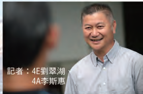
記者：4E劉翠湖 4A李斯惠

最後，馮先生認為學業成績固然重要，但良好的品格更加不可忽視，假若一個人做出一些傷天害理的事，即使成績再好也沒有意義。馮先生其實不是要求兒子一定要成績優異，只希望他能盡本份、竭盡所能，他已感安慰和滿足了。在馮先生身上，我們深深感受到父愛偉大，令人動容。