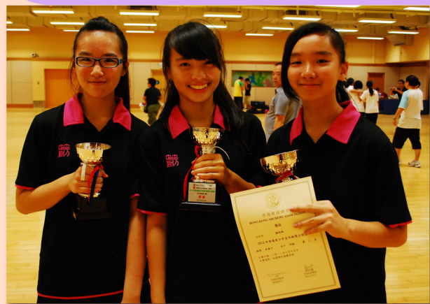
香港青少年室內射箭公開賽

七月，本校箭藝隊分別參加了兩個比賽——香港青少年室內射箭公開賽及聯校射箭比賽；在隊員的努力下，箭藝隊勇奪六獎，可喜可賀。