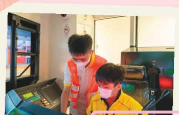
交通學會 輕鐵車廠參觀