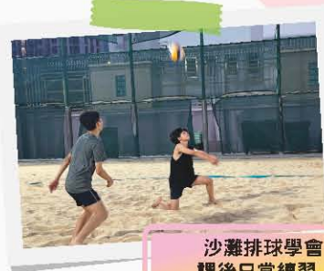
沙灘排球學會 課後日常練習