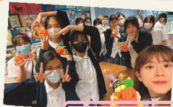
視藝科活動 萬聖節南瓜燈工作坊