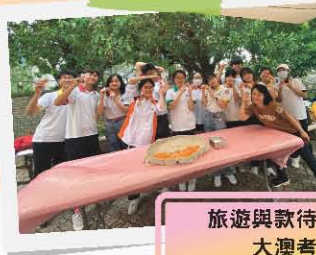
旅遊與款待科活動 大澳考察