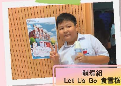
輔導組 Let Us Go 食雪糕